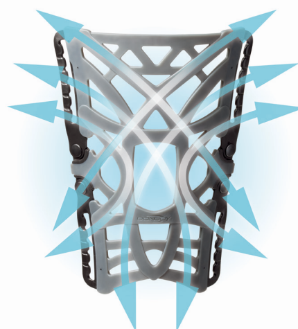
Fig 2 - Le membrane flessibili si allungano e ritornano seguendo il movimento dell'articolazione